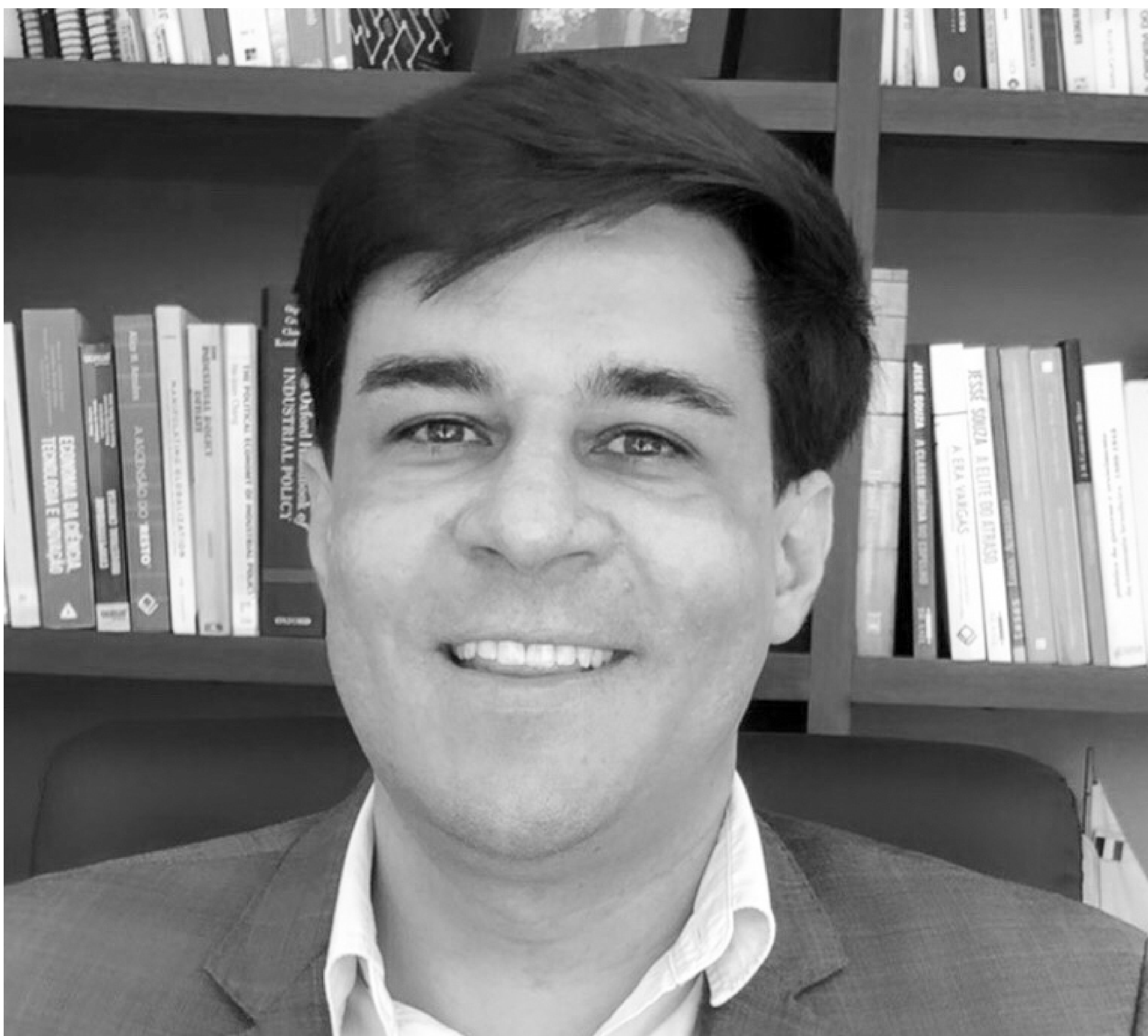
Antônio Carlos Diegues

No caso do Brasil, a combinação da retomada da agenda de políticas industriais com o acirramento da guerra tecnológica entre China e EUA pode abrir espaços para a utilização de uma estratégia diplomaticamente ativa que busque se beneficiar desse contexto.